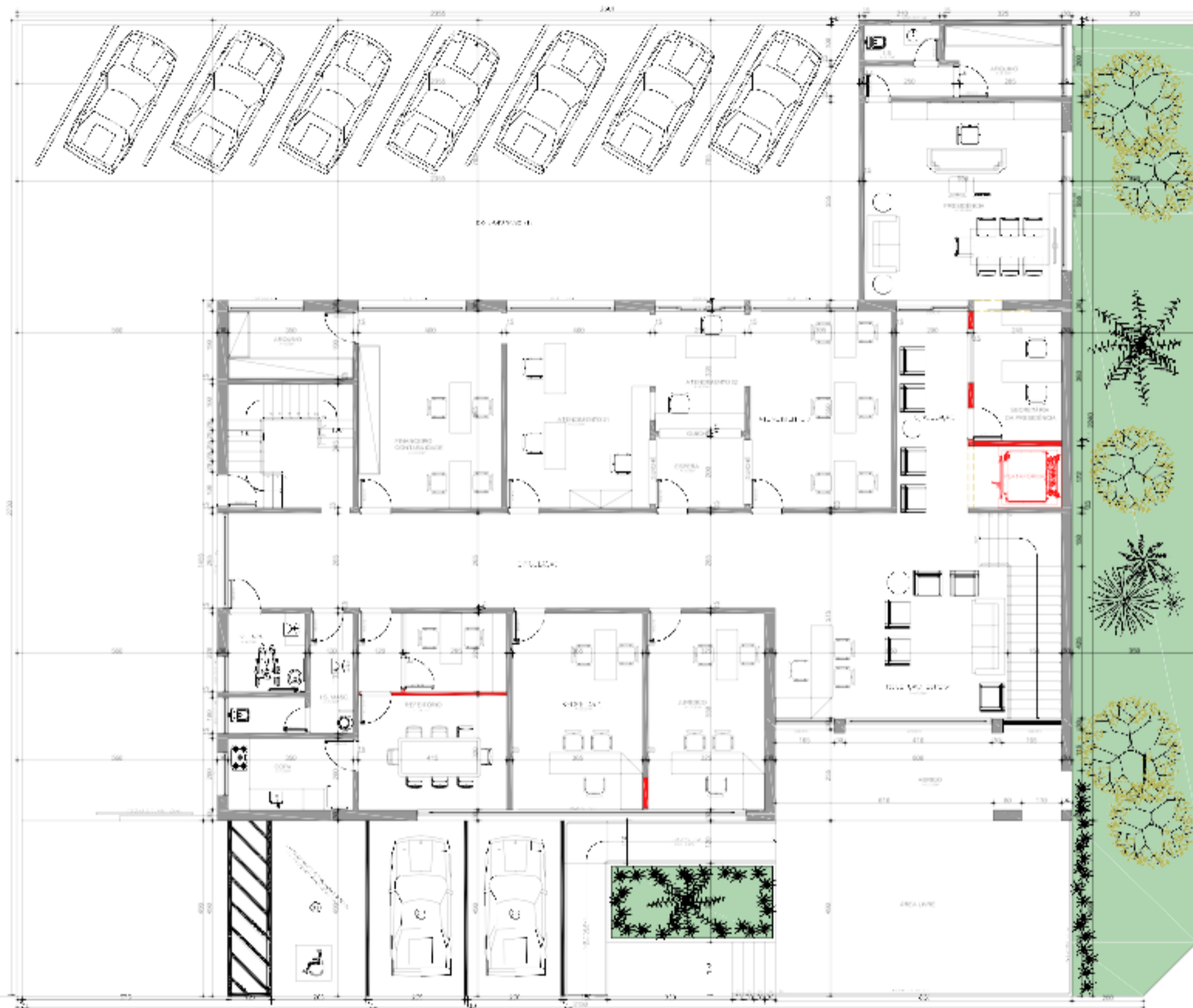
PLANTA BAIXA PAVIMENTO TERREO